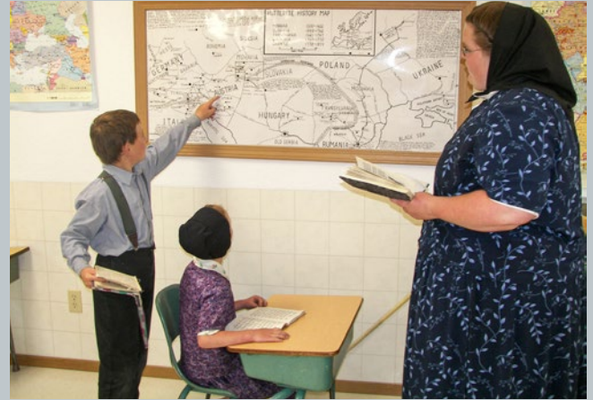
„Wo kommen wir her?“ fragt der junge Hutterer. Im Bild die Wanderungen von Tirol bis in die USA | “Da dove veniamo?” chiede il giovane Hutterita. L'immagine mostra le migrazioni dal Tirolo negli USA

La storia di quasi 500 anni degli Hutteriti, scacciati dal Tirolo nel XVI secolo, è quella di una minoranza emarginata e perseguitata a causa delle sue idee religiose e della sua organizzazione comunitaria. L'attenzione si concentra anche sulla pluralità e sull'apertura alle idee nuove. Gli insegnamenti degli anabattisti erano molto popolari in Tirolo, così come a Chiusa. Uno dei più importanti predicatori e leader religiosi degli Hutteriti, Peter Walpot, era originario di Chiusa. D'altra parte, gli Hutteriti furono soggetti a una spietata persecuzione, come dimostrano anche esempi importanti di Chiusa.