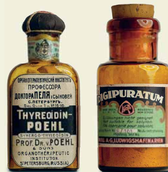
Hochwirksame, chemisch reine Arzneistoffe um 1900 Principi attivi chimicamente puri ed altamente efficaci, 1900 ca. Highly effective, chemically pure medications from around 1900

In addition to the resources provided by Nature and the pharmaceutical art, chemistry has created new medicaments: morphine to relieve pain, penicillin to combat infection, benzodiazepine to cure depression, and so on.