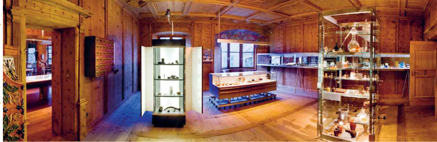
Holzgetäfel aus der Zeit der Renaissance Rivestimenti lignei d'epoca rinascimentale Panelling in wood from the Renaissance era